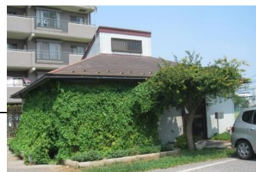
ユーアイやちよ前景 (緑のカフェで快適です)