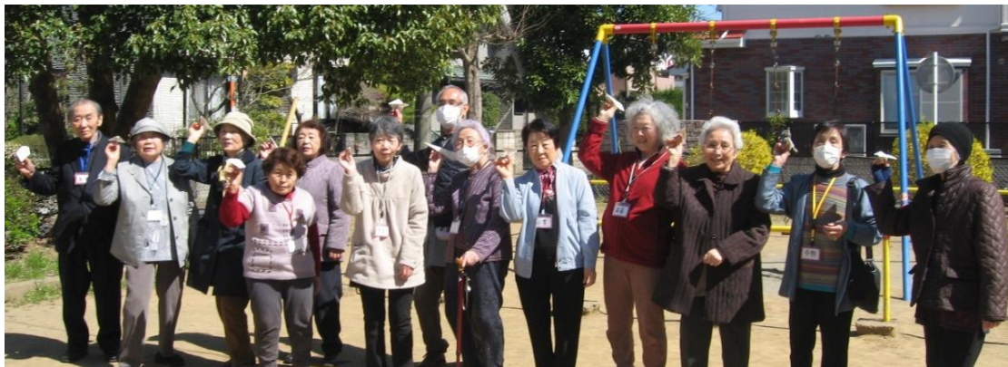
(当法人の活動から)