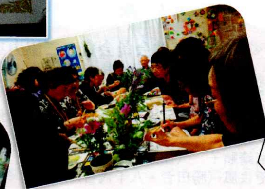
萱田町ふれあいサロン 絵手紙や調理実習も真剣な表情で