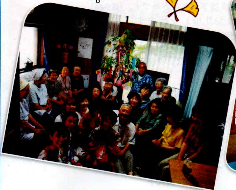
八千代台北サロン かわい子ちゃんと 一緒に七夕飾り！