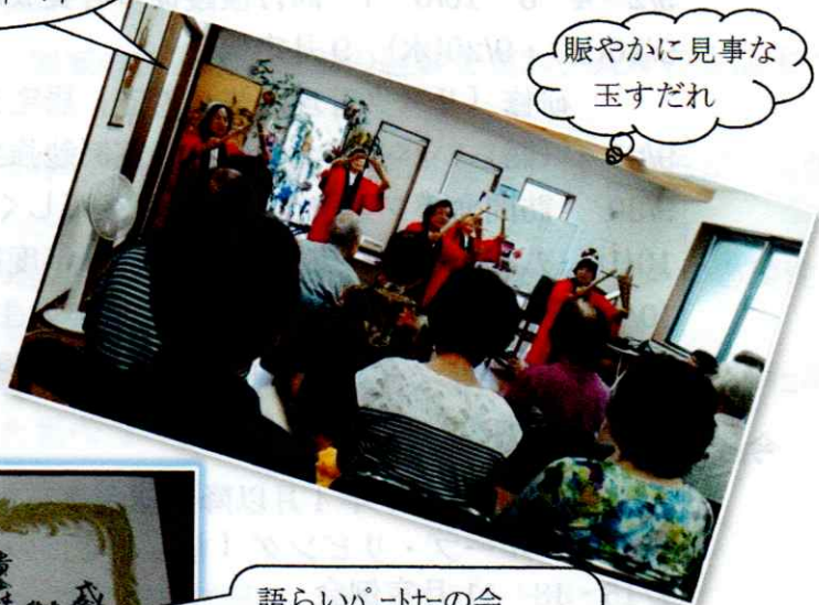
賑やかに見事な 玉すだれ