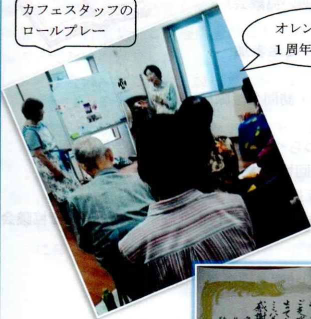
オレンジカフェ 1 周年記念イベント